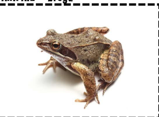
DAILY DISTANCE TRAVELLED