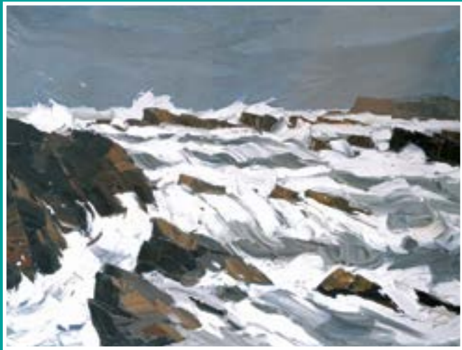
Storm yn Nhrearddur. olew ar gynfas, 1987. © Oriol Môn

Cyrraedd: Mae sawl bws yn stopio yn Lôn Sant Ffraid, yn union y tu ôl i'r maes parcio. Parciwch yn y maes parcio (cod post LL65 2YR).