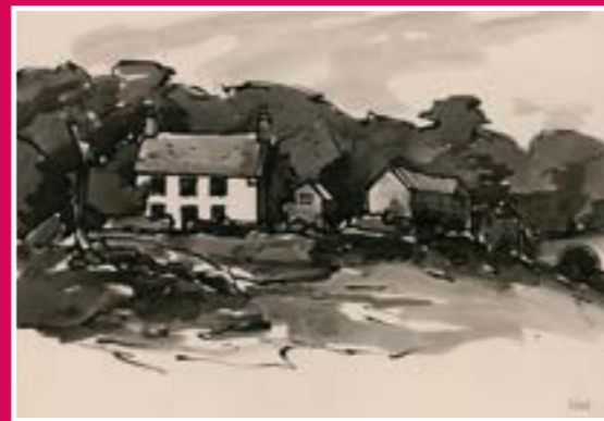
Pwllfanogl. inc ar bapur. © Oriol Môn

Cyrraedd: Lleolir gorsaf Llanfairpwll oddi ar yr A5, i'r de-orllewin o'r pentref. Mae sawl bws yn gwasanaethu'r A5 - gofynnwch am arhosfan yr Orsaf (Llwybr A) neu arhosfan Rhyd Menai (Llwybr B – sydd wedi'i leoli 0.9 km/0.5 milltir i'r dwyrain ym Mhorthaethwy). Parciwch yn Y Gors (cod post LL61 5TX) ar gyfer Llwybr A neu ar safbwyntiau Afon Menai ar gyfer Llwybr B.