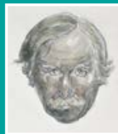
Hunanbortread. © Oriol Môn.

Gweithiodd Kyffin mewn amryw o gyfryngau ond y darnau mwyaf adnabyddus yw ei baentiadau olew tirwedd mawr o dirweddau garw Cymru, gan gynnwys llawer o Ynys Môn. Roedd yn aml yn addysgu pwysigrwydd braslunio a pheintio yn yr awyr agored. Mae ei waith yn darlunio gwylltineb y tirweddau yr ymwelodd â nhw, gan ddarlunio moroedd stormus a thywydd gwael yn aml.